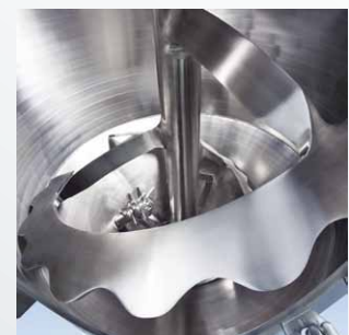
SinConvex® Mischwerkzeug für bis zu 99,99% Restentleerung

Alle Dosierorgane verzögern sukzessiv den Massenstrom und schalten dann gleichzeitig aus und verschließen. Der Mischer entleert sich kontinuierlich bis zum letzten Rest. Rieselfähige Güter fließen restlos aus.