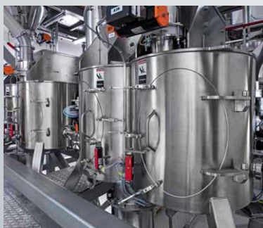
HM-1-7001-2015RU HM 2000 для пищевых стабилизаторов