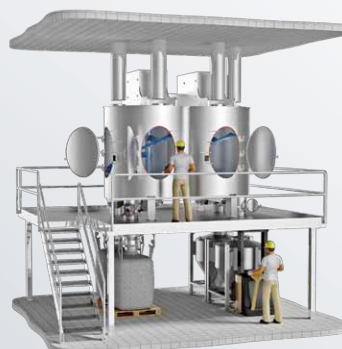
Отсутствие несмешанного продукта благодаря трехмерному перемешиванию

ComDisc® (запатентованный) для идеальной разгрузки материала, изготовленный из износостойкого пластика, с допуском FDA.